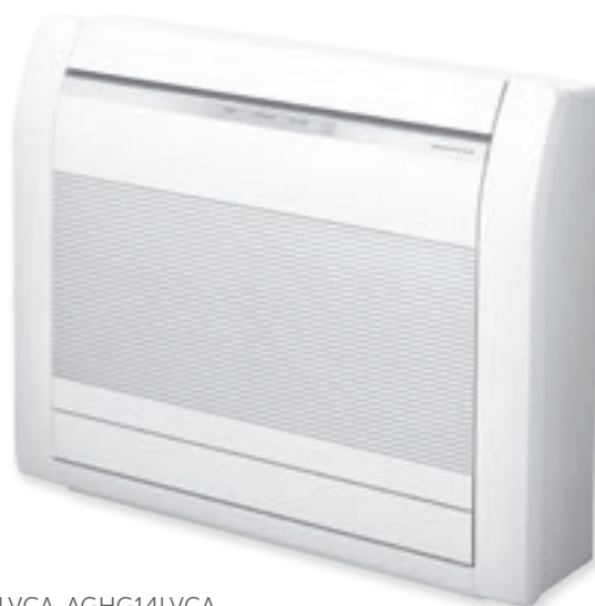
AGHG09LVCA, AGHG12LVCA, AGHG14LVCA

Напольные кондиционеры серии Floor в первую очередь предназначены для эффективного обогрева воздуха и для использования в помещениях сложной конфигурации. Эффективное воздухораспределение и компактные размеры позволяют гармонично вписать внутренний блок в подоконные ниши, а также специально создаваемые ниши в стеновых перегородках, возводимых при перепланировке квартир. Внутренние блоки имеют очень низкий уровень шума, практически неуловимый человеческим ухом. В комплекте поставляются ионный деодорирующий фильтр и яблочно-катехиновый фильтр, обеспечивающие тонкую очистку воздуха.